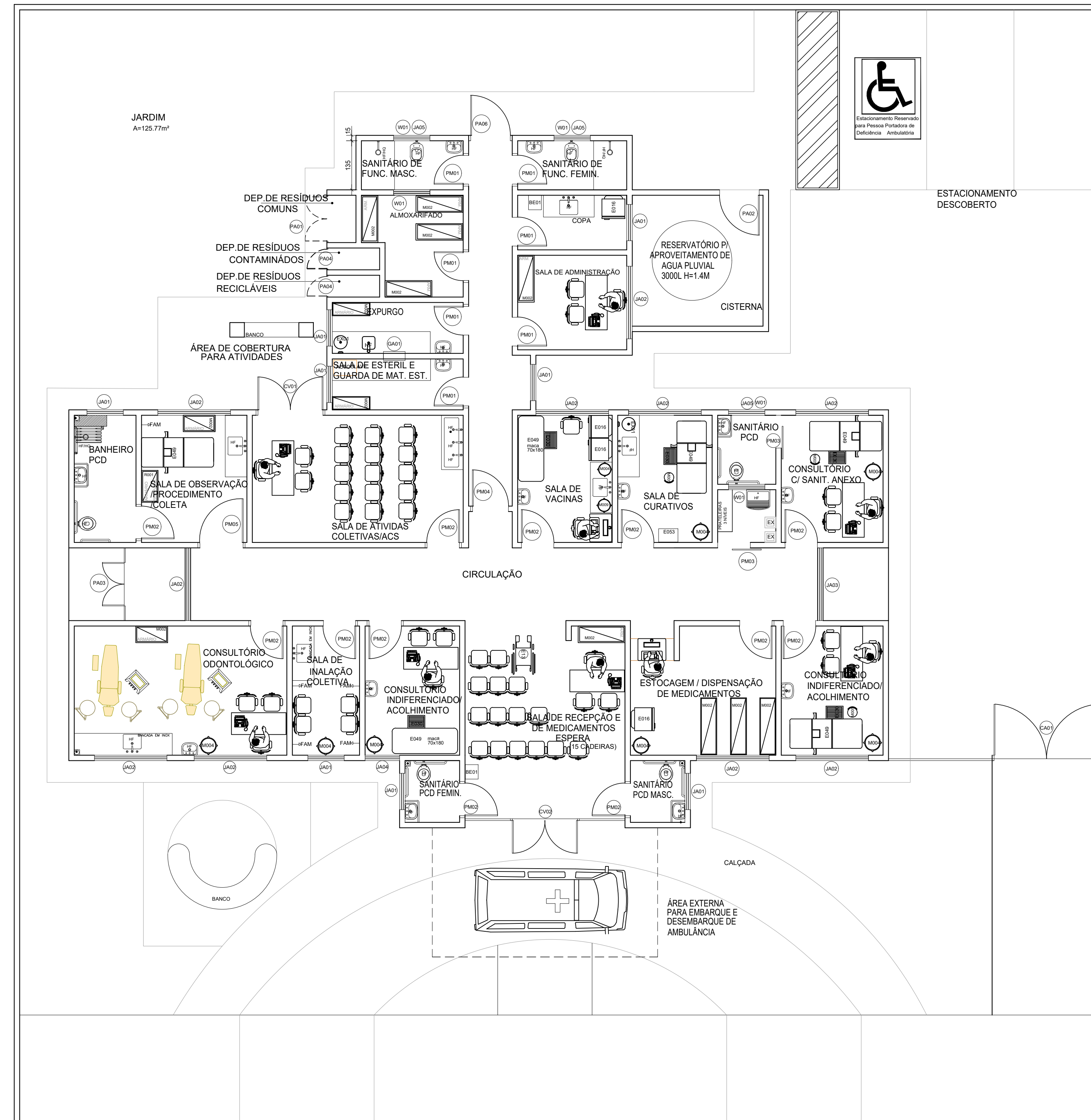
PLANTA LAYOUT MOBILIÁRIO E EQUIPAMENTOS ESC. 1:75